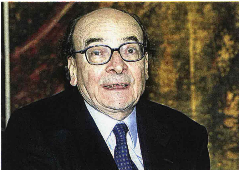
Il filosofo e storico della filosofia Tullio Gregory aveva 90 anni ed era una delle figure più importanti della cultura italiana. Professore emerito alla Sapienza di Roma, era entrato giovanissimo alla Treccani, nel 1951